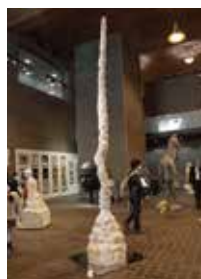
木村 知史 作品名「code」