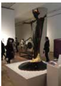
佐野 圭亮 作品名「揺れ動く知性」