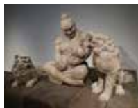
三好 桃加 作品名「オフの日」