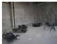
植松 美月 作品名「光の森」