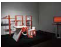
加藤 皓之進 作品名「Typecollage」