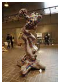
小野 海 作品名「prism-七彩山」